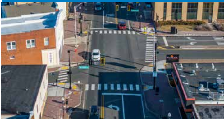
Extensiones de aceras / Cruces peatonales de alta visibilidad