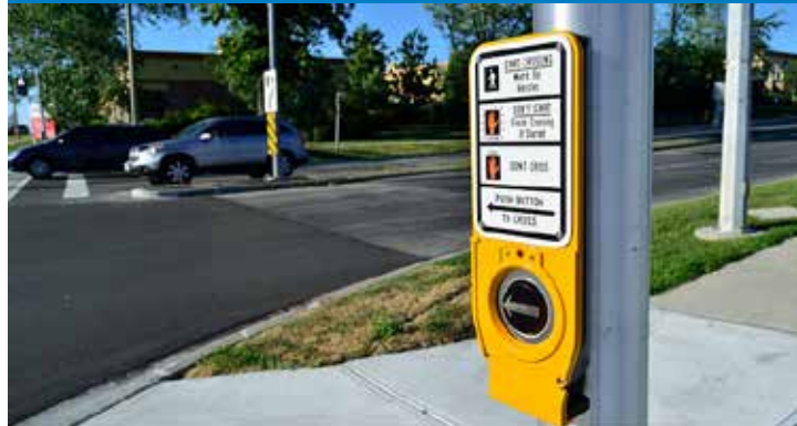
Botones pulsadores mejorados / intervalo de peatones guía