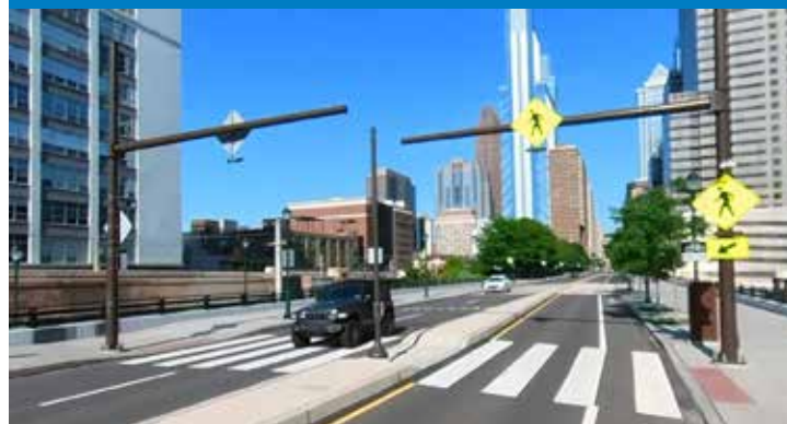
Cruce a mitad de cuadra