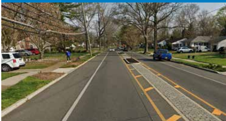
Nueva isla mediana