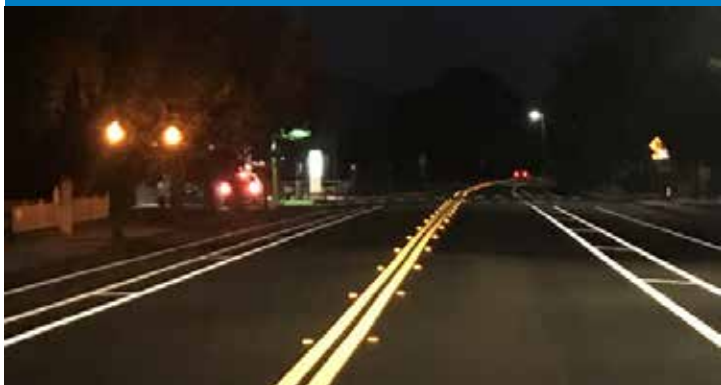
Marcadores de pavimento elevados